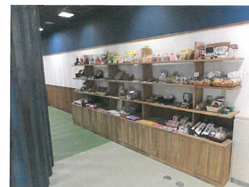
レインボーショップ

おも かつどう きゅうしみんかいかん かいせつ 主な活動は、旧市民会館に開設して かくじぎょうしょ じゅさんせいひん はんばい いた、各事業所の授産製品を販売する レインボーショップの運営があります。