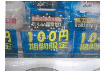
じどうはんばいき は てんじ 自動販売機に貼った点字

げんざい かいいん めいじゃく れいかい てう 現在の会員は10名弱で、例会では手打ち 点字器で市役所の封筒への点字表示やハート フル1階にある自動販売機に貼る点字シール 作成、視覚障害者の方から要望があれば、 料理レシピや歌詞点訳など、できる範囲で 対応しています。