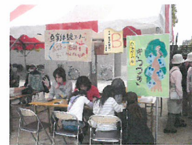
ぎょうじ かつどう ようす 行事で活動している様子

しかくしょうがいしゃ こうりゅう 視覚障害者のみなさんとの交流として はなみ なつ こうりゅうかい ふゆ ぼうねんかい いざかや 花見や夏の交流会、冬は忘年会を居酒屋で 楽しんでいます。