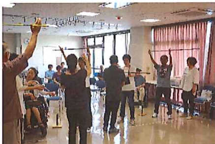
ふきや きほんどうさ さほう スポーツ吹矢には基本動作(作法)があります。

さんか みな ねっしん きょうぎ と く ようす じかん や 参加された皆さんは熱心に競技に取り組まれた様子で、2時間は「矢のように」 す 過ぎました。