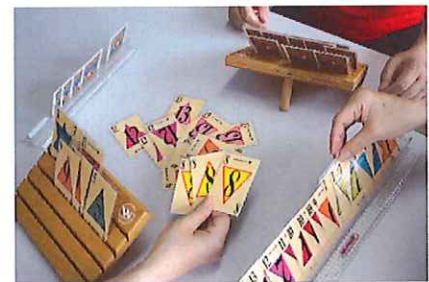
手の代わりにカードを支える自助具