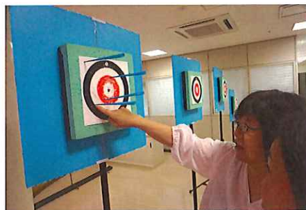
なんてん 何点になるのかな？

まと ちゅうしん しろ ぶぶん 的は中心の白い部分 てん そとがわ が7点、その外側の あか ぶぶん てん 赤い部分が5点、その そとがわ しろ ぶぶん 外側の白い部分が てん そとがわ 3点、さらに外側の くろ ぶぶん てん 黒い部分が1点です。