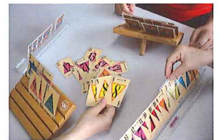
手の代わりにカードを支える自助具

トランプの「大富豪」に似たルールです。 1が1枚、2が2枚…12が12枚、 13が13枚の全部で91枚を使うゲームです。 同じ数字のカードを一度に出すこともでき、 場合によっては、大逆転することもあります。 誰がどのカードをいつ出すのか…駆け引きが うまれ、ハラハラドキドキの興奮があります。