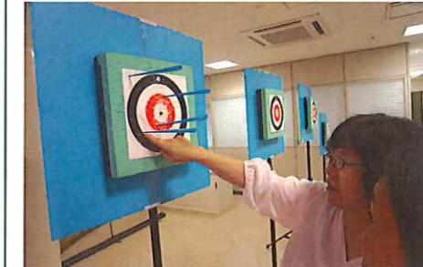
なんてん 何点になるのかな?

まと ちゅうしん しろ ぶぶん 的は中心の白い部分 てん そとがわ が7点、その外側の あか ぶぶん てん 赤い部分が5点、その そとがわ しろ ぶぶん 外側の白い部分が てん そとがわ 3点、さらに外側の くろ ぶぶん てん 黒い部分が1点です。