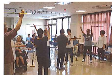
ふきや きほんどうさ さほう スポーツ吹矢には基本動作(作法)があります。

さんか みな ねっしん きょうぎ と く ようす じかん や 参加された皆さんは熱心に競技に取り組まれた様子で、2時間は「矢のように」 す 過ぎました。