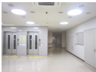
LED交換後の様子 (写真左：1階玄関ロビー、写真右：地下エレベーター前)