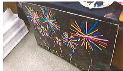
作品展示の様子（写真3枚：左…地域活動支援センター利用者共同作品 クリスマスツリーと雪だるまの壁画、中央…生活介護利用者作品 ハロウィンのリース、右…生活介護利用者共同作品 花火の壁画）