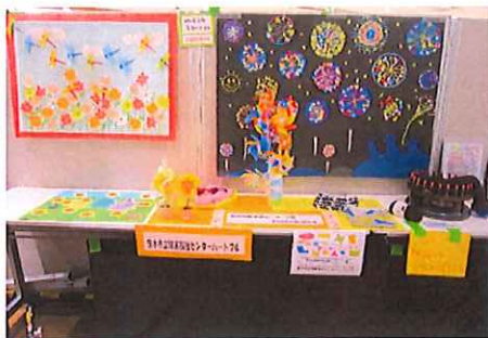
（写真：地域活動支援センター利用者共同作品 とんぼやコスモス、花火の壁画、風車等）が展示されている様子）

令和5年2月13日（月）～19日（日）10：00～16：00 イオンタウン茨木太田2階催事スペース 茨木市地域活動支援センター4 事業所（「菜の花」「ハートフル」「なんでも」「ひまわりの杜」）の存在をより多くの市民の方や当事者の方に知ってもらうために、アート作品展示や様々な体験ブースを予定しています。