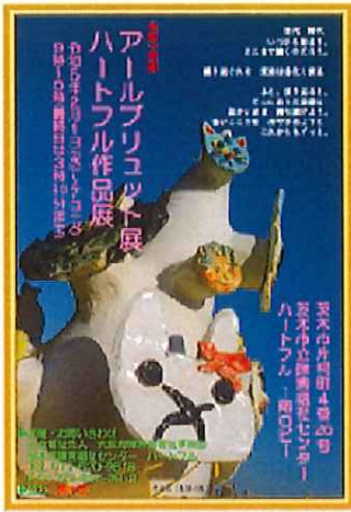
アールブリュット展・ハートフル作品展のポスター（写真：中央に作品名「希望の塔」＝大小さまざまなうさぎや猫、人の顔が白い塔に多数貼り付けられている。が青空の下に写っている。開催日時・場所も記載されている）