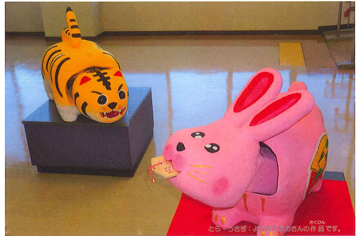
とら・うさぎ：ようきすなおさんの作品です。