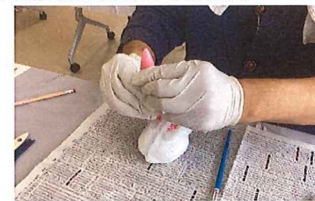
塗料やシールを使って・・・