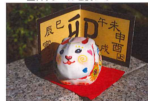
かわいいこんな作品もできました