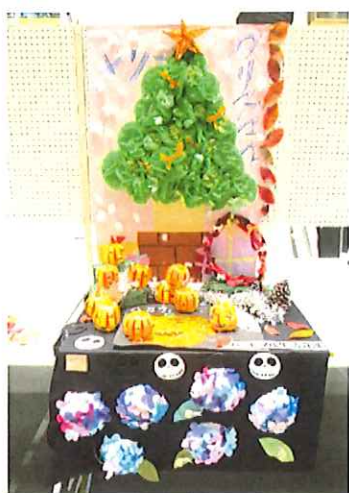
《生活介護「季節のオブジェ」》

障害のあるなし関係なく個性あふれる数々の作品が終結 みんなで創るアートな世界へようこそ！」と書いてある垂れ幕が吊るされ、その後ろに降幸龍が全身が見えるように吊るされている。）