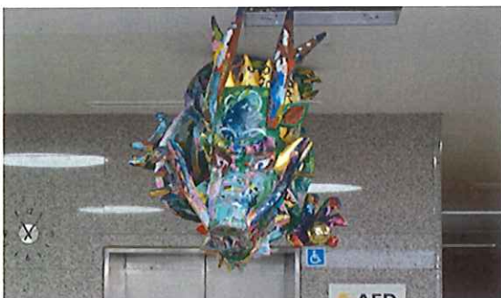
ハートフルロビーのエレベーター前に天井から吊るされている降幸龍。