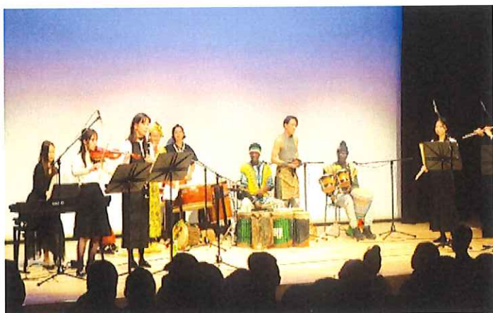
《合同セッション》AddOn、黒拍子、オレダブエコのメンバーのみなさんがそろって演奏している様子