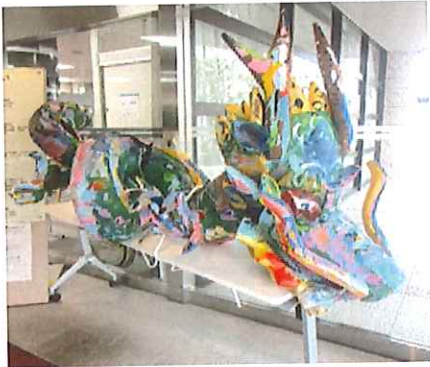
《入口に鎮座する降幸龍》ハートフル入口の風除け室右側に、白い机の上に降幸龍が置かれている。