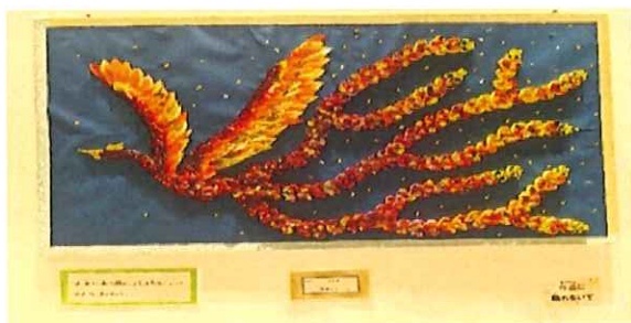
《火の鳥：地域活動センター・生活介護共同作品》