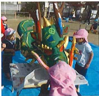
張り子で作られた龍に、茨木幼稚園の園児たちが色を塗っている様子。完成した作品が「降幸龍」と名づけられた。

少しだけ、この龍の紹介をします。京都の神社などで描かれている龍は、天を突き刺すように昇っているように見えます。ハートフルの龍はその逆で、天から降りてくる途中の姿をしています。昇り龍は勢いがあり生気がみなぎっている象徴で、降龍は昇りきったあとで勝ち取った玉（宝・幸福）を授けるために下界を見ているそうです。大きさは約2メートル、たいしたものです。『降幸龍』と名付けました。この龍に世の幸を託し、飛躍の年にしたいと思います。本年もどうぞよろしくお願いいたします。（所長 原）