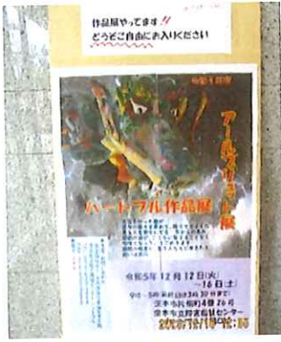
《降幸龍のポスター》