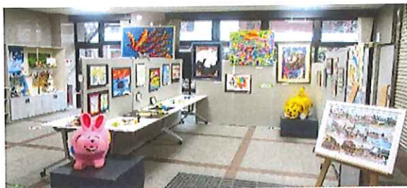
《ハートフル南側ロビーの様子》左側に過去の陶芸作品が並んでいる。

右側に絵画の作品が囲むように並んでいる。中央よりやや左に、ピンクのウサギの置物が紺の台の上に置かれている。