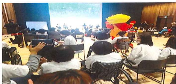
《音を楽しもう講座 ホールの皆さんも一緒に》

きたしんホールの客席後ろから撮影された写真。生活介護のみなさんが発表を観覧している姿が映っている。またホール