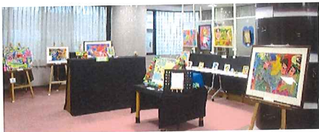
《ハートフル北側ロビーの様子》絵画の作品が北側ロビーを取り囲むように並んでいる。