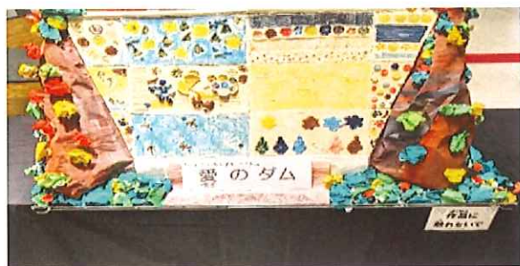
《ハートフル陶芸講座共同作品 愛（安威）のダム》