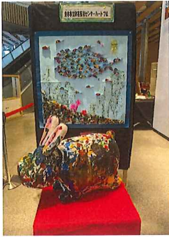
《広報いばらきの表紙のうさぎ》 地域活動支援センターⅡ型のペーパークイリングで作成された魚の作品の前に、広報いばらきの表紙に掲載されたうさぎが赤い台の上に置かれている。