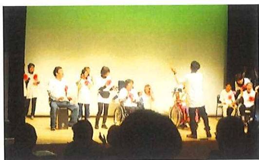
《生活介護の皆さん》生活介護の利用者・職員が舞台上で演奏している。