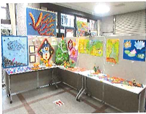
《ハートフル南側ロビーの様子》生活介護・地域活動支援センターII型の作品が並んでいる。