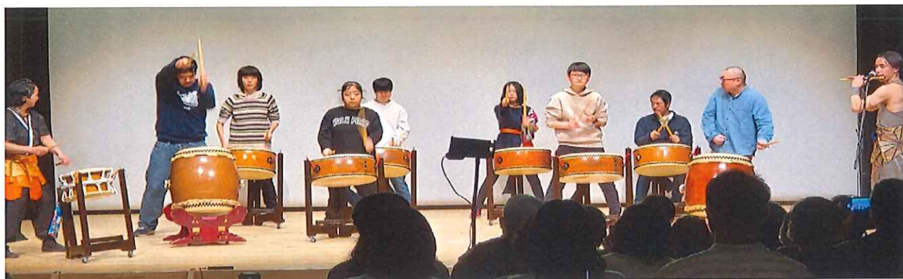
《和太鼓講座の皆さん》きたしんホール舞台の上。右端には笛を吹く講師の先生。左端は太鼓を叩く講師の先生。その間で講座の受講生8人が和太鼓を演奏している。