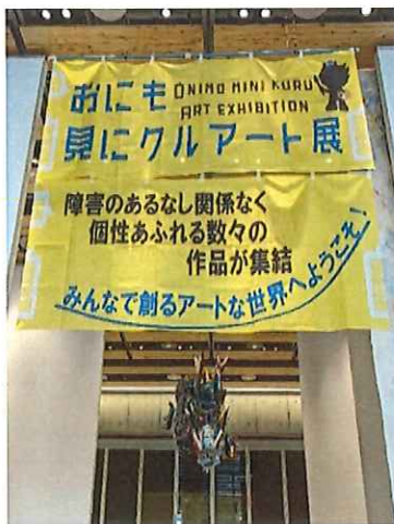
《降幸龍がお出迎え》おにクル正面玄関入ってすぐの天井付近に「おにも見にクルアート展

人権及び障害福祉への理解・啓発を目的に各関係機関が一堂に「おにクル」に集まり、12月5日（火）～12月8日（金）の期間、アート・作品展が開催されました。ハートフルからも生活介護・地域活動支援センターⅡ型・陶芸講座・北摂地域の芸術作家さんたちの素晴らしい作品を出展しました。