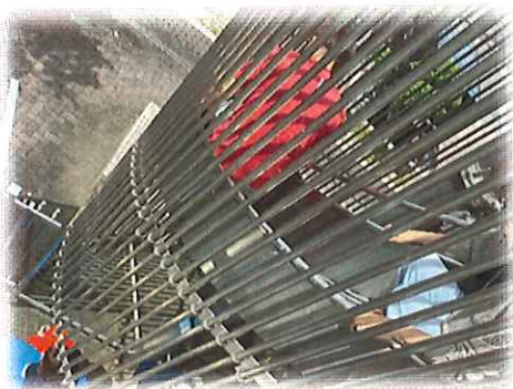
非常用屋外滑り台を滑り、1階へ避難する訓練参加者。