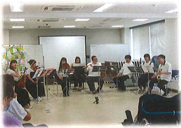
あとおん Addonの皆さんが演奏されている。対面で聞きいる利用者の皆さん。

令和6年8月3日（土）に余暇活動の一環として、 あとおん Addonアンサンブルの皆さんをお迎えして、バイオリンやサクソ等 の演奏をして頂きました。真夏の厳しい暑さの中でしたが、コンサートで利用者の皆さんと感動を共有でき、元気をもらえ た素晴らしい時間を過ごせました。