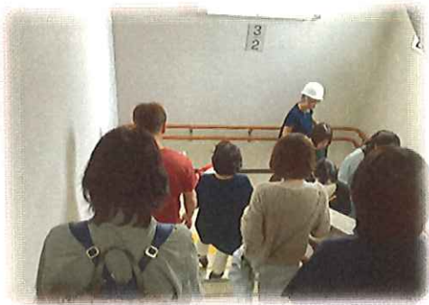
職員（防災委員会）の指示に従い、階段を降りる避難訓練参加者。