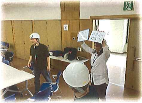
4階大会議室出入口付近で、職員（防災委員会）が避難指示をしている。

も参加しました。ハートフル館内の防災設備等の説明後、2グループに分かれて非常用屋外滑り台を使った避難訓練を行いました。それぞれのグループに手話通訳者と要約筆記者が聞こえない人たちのサポートをされていました。職員（防災委員会）が携帯用ホワイトボードを使って避難の方法等を伝えるなど、情報の伝達を工夫する訓練にもなりました。災害はいつ起こるかわからないので、今後も協力して防災を進めていきます。