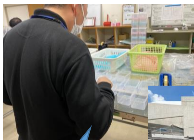
けいさぎょう 軽作業