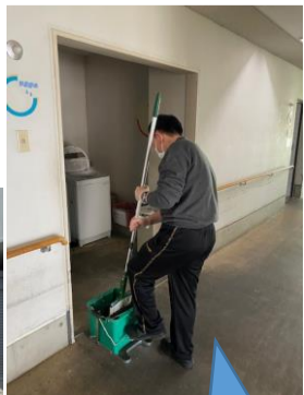
かんにせいそう 館内清掃

就労移行支援には、現在13名の方が通所され、就職を目指して様々なプログラムに 取り組まれています。