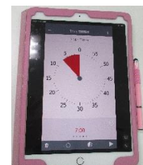
アプリのタイムタイマー