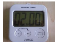
キッチンタイマー