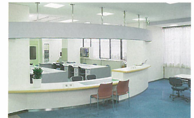
センター事務所(1階)