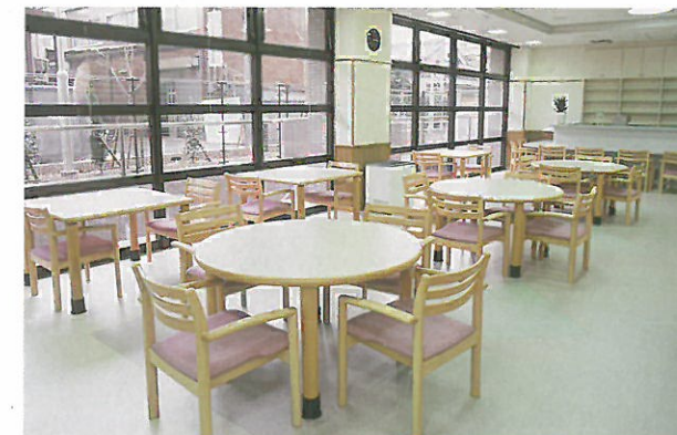
レストラン ハートフル(1階)