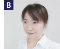
地域生活総合支援センター:副所長