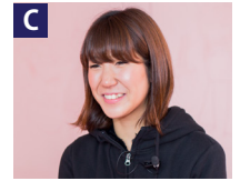
障害児施設:支援員