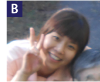
特別養護老人ホーム:支援員