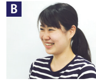
障害児入所施設:支援員