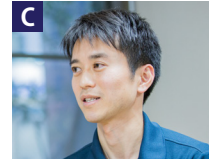
デイセンター:介護長