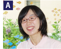
特別養護老人ホーム:支援員