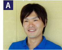
生活介護事業所:主任生活支援員