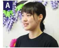
特別養護老人ホーム:支援員